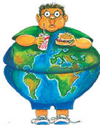
Sovrappeso e obesità per regione, bambini di 8-9 anni della 3ª primaria. Italia, 2008

Recenti dati ISTAT evidenziano che in Italia sono oltre 4,7 milioni le persone adulte obese. In generale, il problema obesità si concentra soprattutto al Sud Italia e tra le fasce di popolazione con basso status socioeconomico. Netta è la relazione tra basso livello di istruzione ed eccesso ponderale: tra gli adulti con titolo di studio medio-alto la percentuale degli obesi si attesta intorno al 5% mentre triplica tra le persone che hanno conseguito al massimo la licenza elementare (15,8%). La regione con più alto numero di bambini in sovrappeso o obesi è la Campania (36 % e fino al 40 % nella popolazione scolare napoletana) mentre il numero più basso di bambini sovrappeso/obeso è in Valle d'Aosta (14,3 %); in genere si nota come il problema dell'obesità infantile peggiori scendendo dal nord al sud del Paese (fig.1). Malgrado tali evidenze, e senza prestare attenzione alla pressione sociale che impone di essere magri, la prevalenza degli obesi sta crescendo, tanto da indurre gli esperti a credere che l'obesità debba essere ritenuta uno dei maggiori e più trascurati problemi di salute pubblica del nostro tempo.